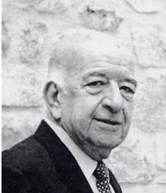
de François Sarda